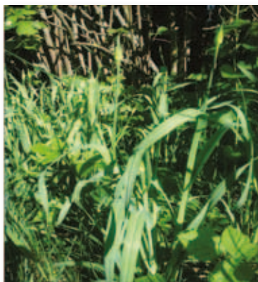
Divji por pred cvetenjem.

Po videzu je divji por manjši in tanjši od navadnega »vrtnega« pora. Po okusu pa je bolj podoben česnu. Značilen je za območje Istre in Krasa, kjer ga lahko najdemo na obrobjih njiv in travnikov. V naših krajih ga je sicer manj, vendar se tudi zahvaljujoč nepoznavanju te rastline, ta hitro širi. Na območju Pivškega polja ga lahko nabiramo med aprilom in majem, cveti pa konec maja in v juniju. Pri nabiranju moramo biti pozorni, da manjše zarodne čebulčke, ki jih naredi rastlina, vrnemo nazaj v naravo, saj bi lahko rastlina z množičnim pobiranjem, na določenem območju, izginita.