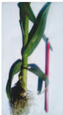
Eden izmed debelejših.

Divji por lahko v kulinariki uporabimo podobno kot navadni por ali česen. Odličen je v namazih, prikudah in mineštrah.