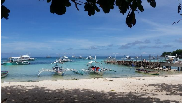
Nevenka Richter Peče