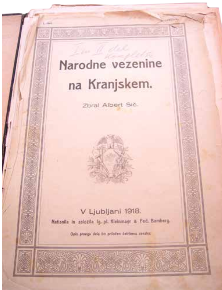
Prva stran iz zbirke »Narodne vezenine na Kranjskem«, ki je shranjena v Knjižnici Mirana Jarca Novo mesto.