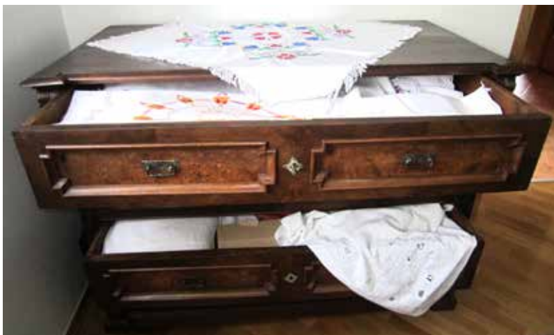
Vezenine v predalniku.

Vezenine shranjujemo v suhih prostorih, dobro zavite v bel papir ali bombažno blago in zložene tako, da je narobna stran zunanja. S pravilnim shranjevanjem preprečimo, da bi vezenine porumenele, se umazale in obledele. Vezenino je potrebno občasno prezračiti, oprati in temeljito posušiti. Najbolje pa je, da vezenine uporabljamo v namene, za katere so bile narejene. Ker pa so vezenine unikatni izdelki, pravzaprav neke vrste umetnine, je prav, da imamo za njih poseben predal ali del omare, kjer jih hranimo. Če pravilno skrbimo za vezenine, bodo le-te ostale dolgo lepe in služile svojemu namenu.