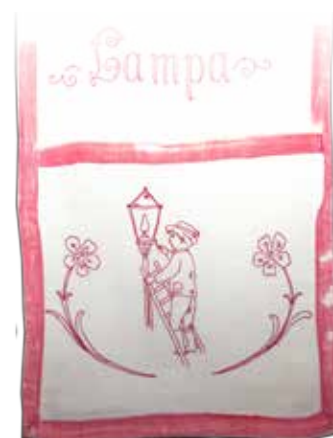
Vrečka, v kateri so shranjevali pripomočke za čiščenje petrolejk, izvezena na bombažnem blagu v tehniki navadno vezenje in polnjenje, izdelala Dana Požek iz Metlike okrog leta 1920.

Kuhinjo je v začetku razsvetljevala petrolejka. V vezeni vrečki so shranjevali pripomočke, ki so jih uporabljali za čiščenje in prižiganje petrolejk.