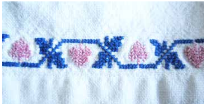
Delček vzorca na rokavcih, narejen v tehniki »mirkanja«.