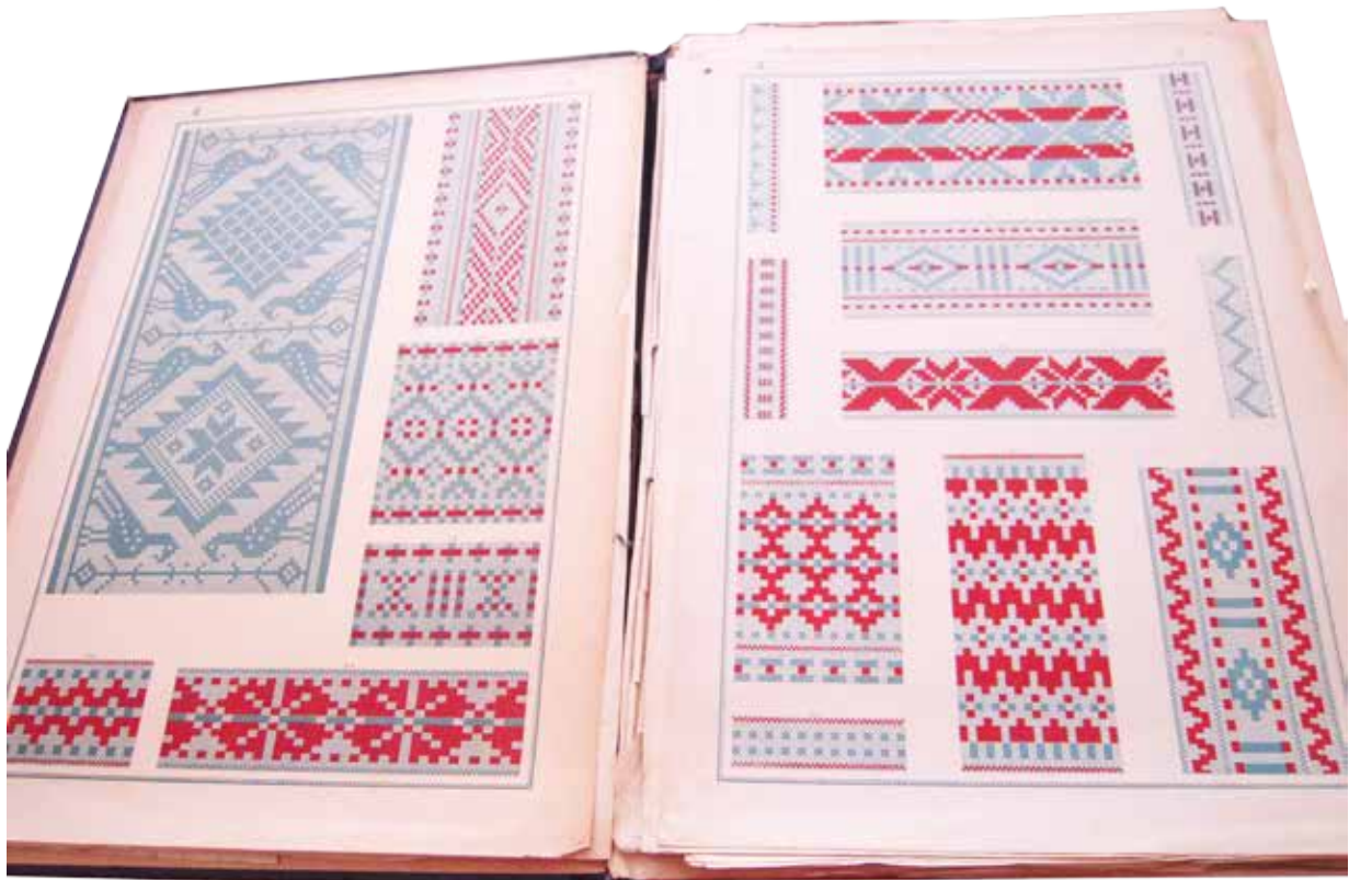
Vzorčni poli iz zbirke »Narodne vezenine na Kranjskem«.