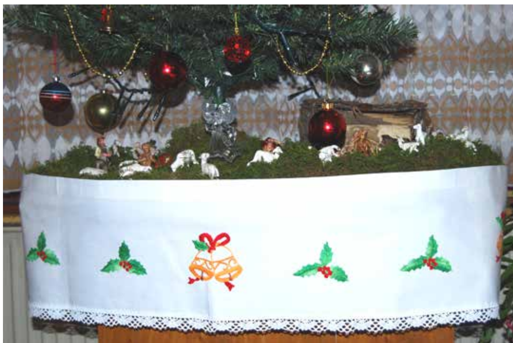
Vezenina iz bombaža za okrasitev jaslic pod božičnim drevescem, tehnika navadno vezenje in polnjenje, izdelala Jožefa Pečavar iz Nestoplje vasi okrog 1950.

Za božič so gospodinje pogrnile po hiši najlepše vezenine, ki so jih imele. Jaslice so pogosto obdali z dolgo vezeno obrobo, okrašeno z vezenino in čipko.