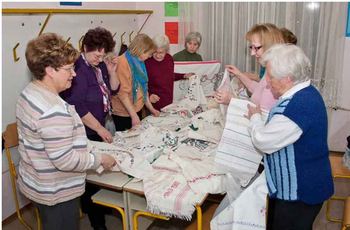
Članice študijskega krožka pregledujejo vezenine, april 2011.

Knjižica z naslovom Vezenine v Beli krajini skozi čas je nastala v okviru delovanja študijskega krožka Vezenje v Beli krajini , ki je potekal na Zavodu za izobraževanje in kulturo Črnomelj v šolskih letih 2010/11 in 2011/12. Študijski krožki so oblika neformalnega učenja, v kateri se zbirajo ljudje, ki se želijo naučiti kaj novega o določeni temi, se družiti in narediti nekaj koristnega za svoj kraj in druge ljudi.