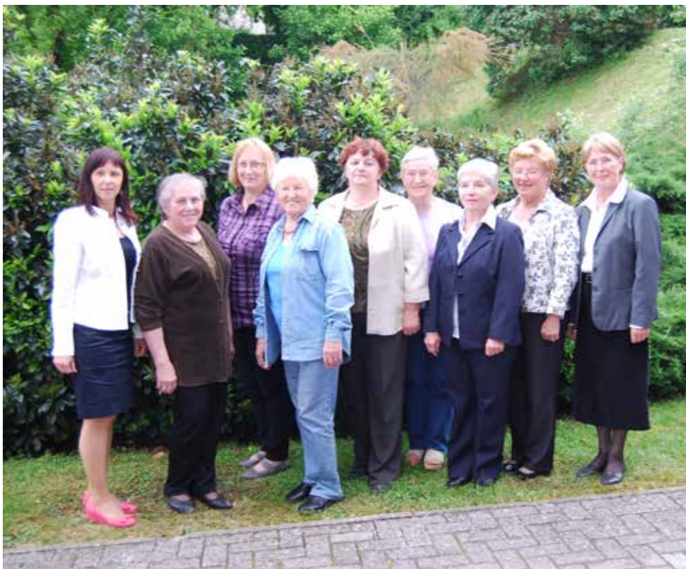
Članice ob zaključku študijskega krožka, maj 2013.

S svojim delom smo hotele spodbuditi vezilje k odprtju razstavnih prostorov po različnih krajih Bele krajine, kjer bi si obiskovalci lahko ogledali vezene izdelke, ki so danes največkrat shranjeni le v omarah.