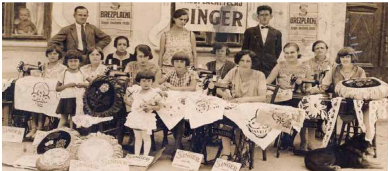
Udeleženke tečaja strojnega vezenja v Črnomlju okrog leta 1935.

Nekatere so postale prave mojstrice strojnega vezenja, postale so poklicne vezilje in si z vezenjem služile skromen honorar.