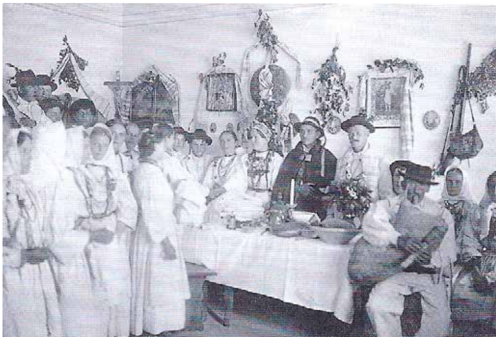
Soba na Vinici, okrašena z otirači ob poroki, fotografija objavljena v knjigi: Slovenski etnološki leksikon, 2004.

Otirače so uporabljali pri raznih ljudskih šegah in navadah, zlasti porokah. Imenovali so jih tudi svatovski robci. Z njimi so okrasili sobo, v kateri je bila svatba, starešina si ga je pripel čez ramo in tudi zastavonoša, ki je šel prvi v poročni povorki, je imel na drogu poleg pisanih trakov pritrjena še dva otirača. Tudi godcu je nevesta dala v dar otirač, ki ga je imel pripetega preko rame. Pa tudi vrtanj (velik, okrogel kolač z luknjo v sredini), ki so ga spekli za poroko, so pretaknili z izvezenim otiračem in ga obesili na steno nad ženinom in nevesto.