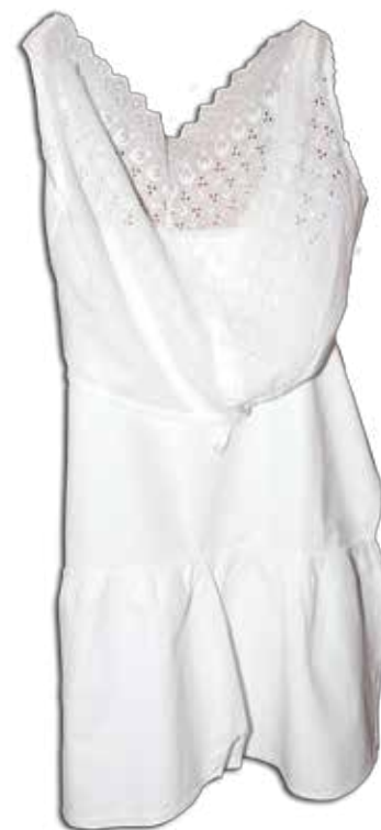
Žensko spodnje perilo iz bombažnega blaga v tehniki richelieu, vezilja ni znana, zgornji del je narejen v Črnomlju, spodnji del v Metliki v začetku 20. stoletja.

Bela vezenina je vezenje v različnih tehnikah z belo nitjo na belo platno. Pogostokrat so jo uporabljali za vezenje posteljnine, perila in otroških oblačil.