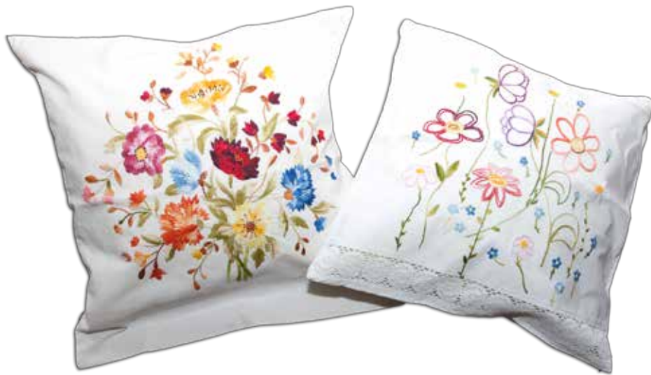
Blazini iz bombažnega blaga v tehniki navadno vezenje in polnjenje, izdelala Tatjana Jakočič iz Dragatuša po letu 2000.