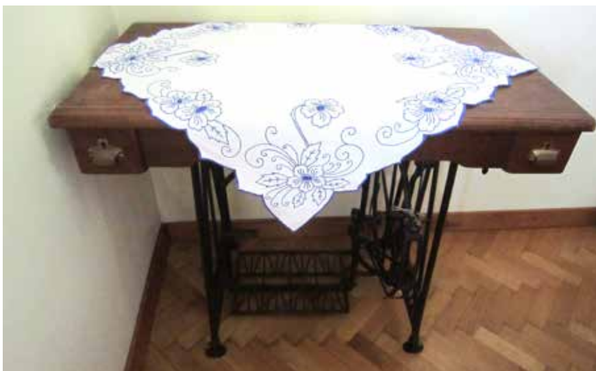
Prtiček iz bombažnega blaga v tehniki navadni in verižni vbod ter obroba, izdelala Ivanka Težak iz Dol leta 1960.

V veliki hiši je bil navadno tudi »kofan«, v katerem so hranili mašni »gvant« (obleko), krstna oblačila, praznične prte in prtičke, »otirače« in bale domačega platna. Tudi ta je bil pregrnjen z vezenino. Če je bil pri hiši šivalni stroj, je bil v veliki hiši. Pregrnjen je bil z vezenim prtičkom.