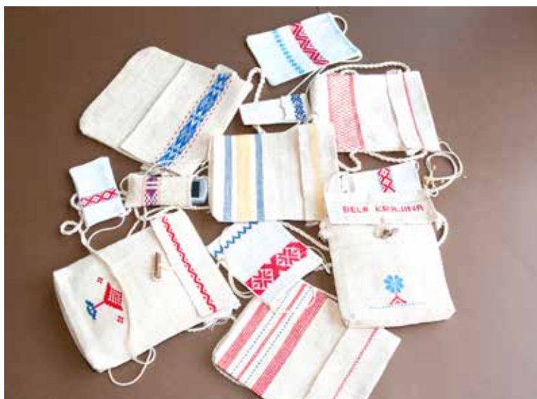
Različne torbice iz domačega platna, v tehnikah tkaničenje, raličenje in štepka, izdelala Ivanka Sajovic iz Drenovca po letu 2000. Svatovski otirač, ki se je ohranil kot slika,