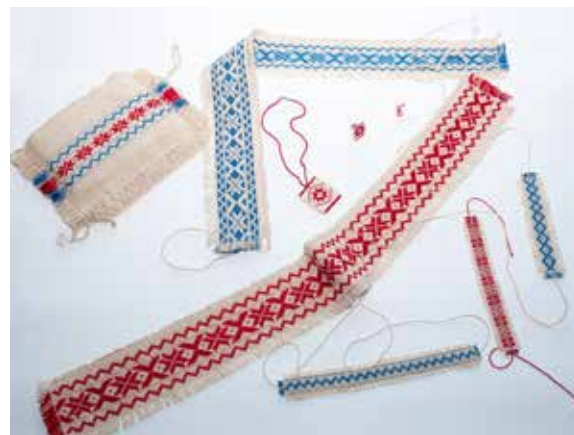
Pasi, zapestnice, ogrlica in uhani narejeni v tehniki tkaničenja, izdelala Mojca Starešinič iz Ravnac nad Suhorjem pri Metliki po letu 2000.