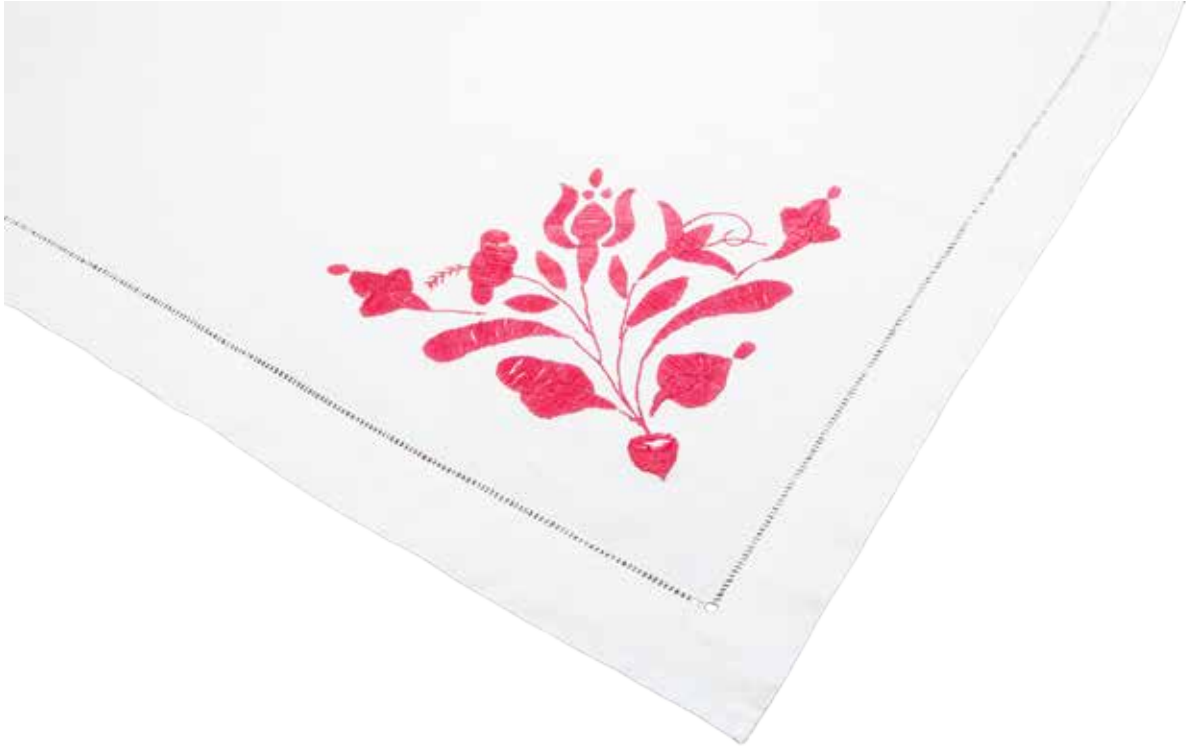
Prt iz bombažnega blaga, izdelala Frančiška Burazer iz Črnomlja okrog leta 1925.

Veliko vezenin je izdelanih na industrijskem blagu, ki je bilo največkrat bombažno, laneno ali mešanica obojega, saj je to veljalo za bolj imenitno kot domače platno. Pa tudi vezenje nanj je bilo lažje, ker ni tako grobo kot domače platno.