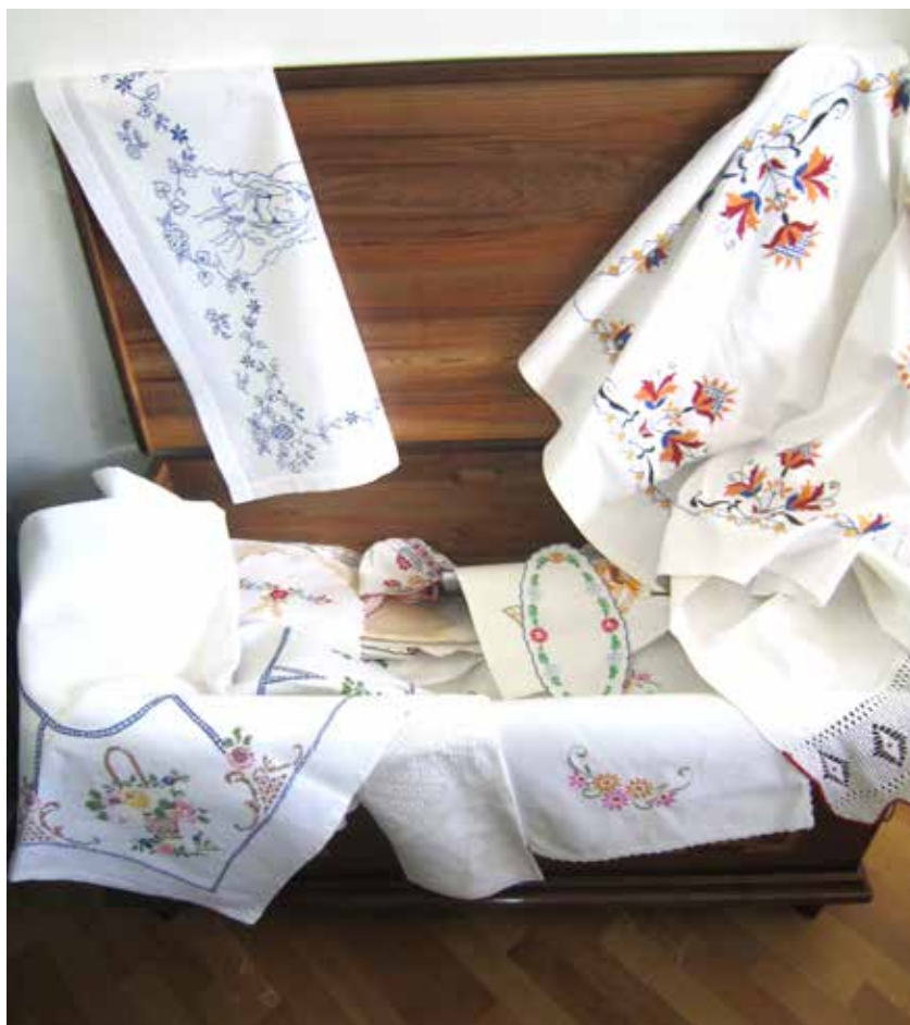
Prti in prtički v »kofanu«.

Mesec pred poroko so prišli prosci (ženinovi starši in bližnji sorodniki) na nevestin dom, kjer so se dogovorili predvsem o nevestini bali. V bali so bile poleg oblačil in pohištva še rjuhe iz domačega in kupljenega platna, pregrinjala, otirači, zavese in druge vezenine. Večino stvari so neveste hranile v skrinji, imenovani »kofan«. Z balo so se tudi postavljale in izkazovale pred drugimi ter dokazovale svoje ročne spretnosti. Vezenina je bila najpogosteje bela, včasih pa tudi barvasta, narejena v različnih tehnikah.