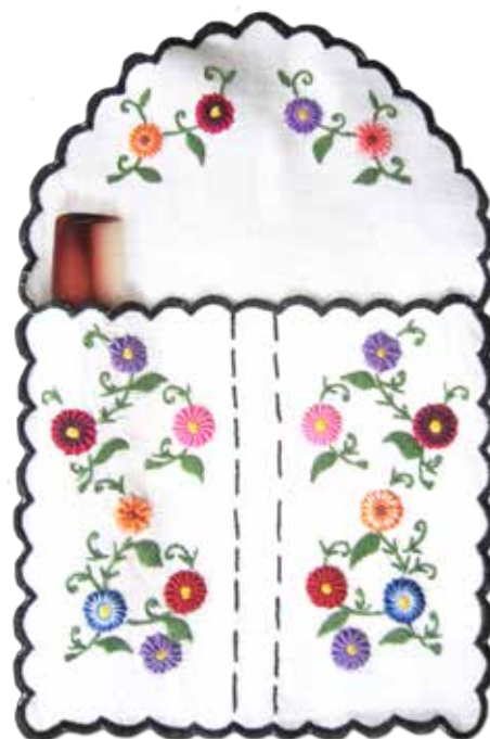
Vrečka za shranjevanje glavnikov in ščetk, izvezena na industrijskem blagu in v tehniki polnjenja, izvezla Franciška Šterbenc iz Črnomlja leta 1935.

Kuhinja je hkrati služila tudi kot kopalnica. Na polici bližje vedra za vodo je viselo majhno ogledalo. Pod njim je bila vezena vrečka z dvema predaloma, kjer sta bila glavnik in ščetka za obleko ter brisača iz domačega platna.