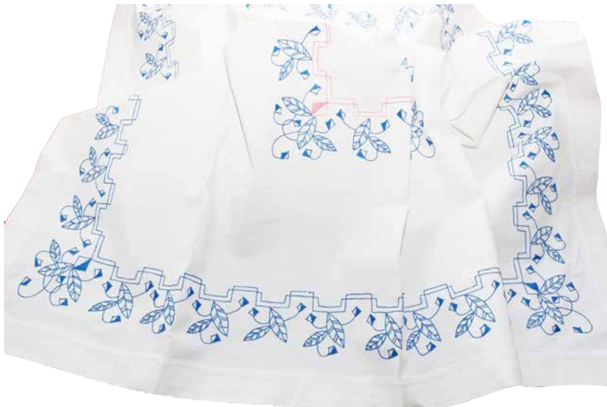
Namizni prt iz bombažnega blaga, izdelala Nežka Kobetič iz Črnomlja okrog leta 1940.

Za barvanje bombažnih niti so uporabljale naravne barve, ki so jih pridobile iz lubja (hrasta, vrbe, breze, jelše), cvetov (regrata, ognjiča, žafrana, kamilice, trobentice, šentjanževke), listov (koprive, rdečega zelja, čebule), plodov (borovnice, kalina, šiške, orehove lupine), pa tudi z ilovico. Tudi v Beli krajini so najstarejše ohranjene vezenine izvezene s prejicami, ki so bile obarvane z naravnimi barvili. Zasledimo največ rdeče, modro, črno, rumeno in zeleno obarvane prejice.