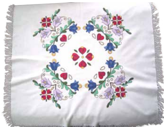
Namizni prt iz bombažnega blaga, narejen v tehniki navadno vezenje in polnjenje, izdelala Milena Starešinič iz Ravnac leta 1960.

V veliki hiši je bil navadno tudi »kofan«, v katerem so hranili mašni »gvant« (obleko), krstna oblačila, praznične prte in prtičke, »otirače« in bale domačega platna. Tudi ta je bil pregrnjen z vezenino. Če je bil pri hiši šivalni stroj, je bil v veliki hiši. Pregrnjen je bil z vezenim prtičkom.