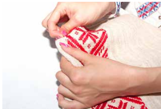
Belokranjsko vezenje ne bo izumrlo, saj se prenaša s starejše generacije na mlajšo.

Ostale v nadaljevanju opisane tehnike, kot so richelieu, navadno vezenje in vezenje s križci, so uporabljali tudi drugod po Sloveniji. Uporabno znanje o njih so v Belo krajino prinesle učiteljice, ki so na šolah učile vezenje.