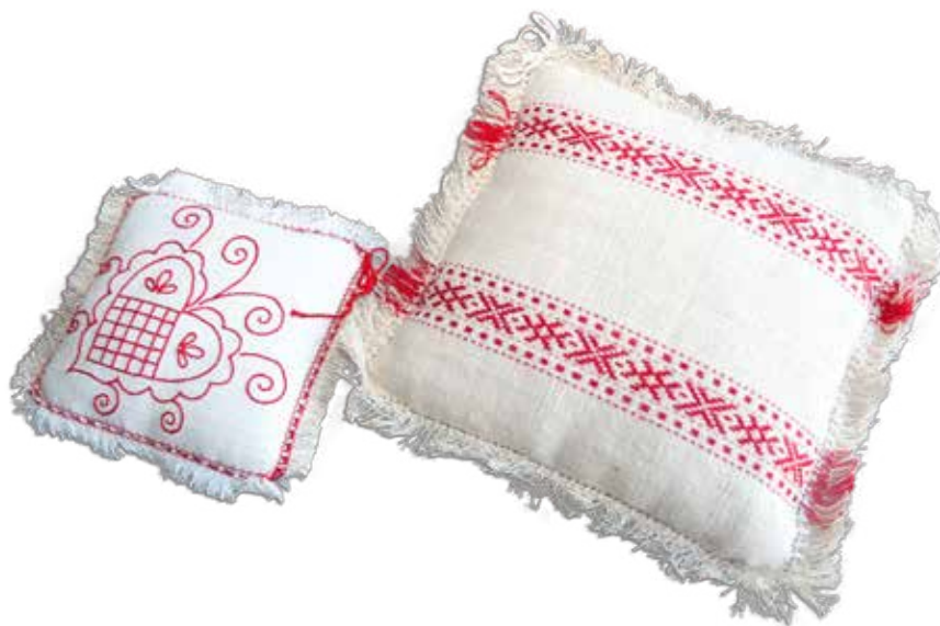
Blazini iz domačega platna v tehniki navadno vezenje in tkaničenje, izdelala Mojca Starešinič iz Ravnac nad Suhorjem pri Metliki po letu 2000.