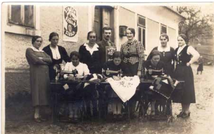
Tečaj šivanja v Črnomlju leta 1937.

Ob koncu tečaja ali šolskega leta so udeleženske vedno pripravile tudi razstavo izdelkov, ki so jih naredile. Nekatere so vezenine tudi prodale, da so si lahko kupile blago ali prejico za naslednje delo.