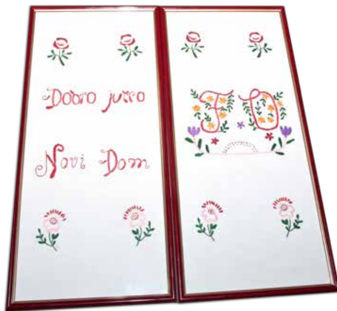
izdelala Ana Ostronič iz Goleka pri Vinici leta 1930.

Za mnoge vezilje predstavlja vezenje način preživljanja prostega časa in druženja, za nekatere pa tudi dodaten vir zaslužka. Predvsem pa je pomembno, da se tradicija prenaša na mlajši rod in se tako ohranja bogata kulturna dediščina.