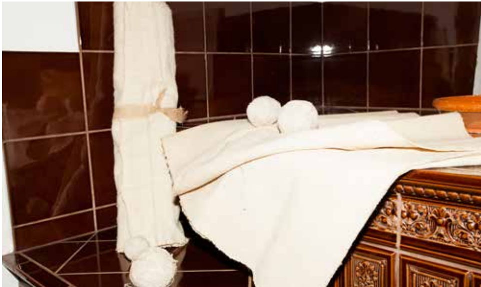
Domače platno, klobčič preje in bala iz časa pred drugo svetovno vojno.

Platno so v Beli krajini naši predniki izdelovali iz lana in konoplje, ki so ju posejali zgodaj spomladi. Konec meseca julija, ko so bilke dozorele, so jih populili s korenino vred, da je bil izkoristek boljši. Zvezali so jih v manjše snopke, »rukoveti«, jih otepli semen in nato za tri dni namočili v vodo. Naredili so močilo in ga obtežili s kamni, da ga voda ne bi odnesla. Potem so »rukovet« sprali in jih sušili.